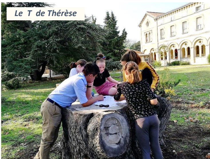
Le T de Thérèse